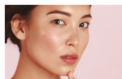
PASO 4: DISMINUIR