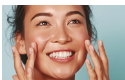
PASO 3: HIDRATAR